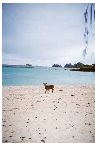
06_ © Alexandre Morvan