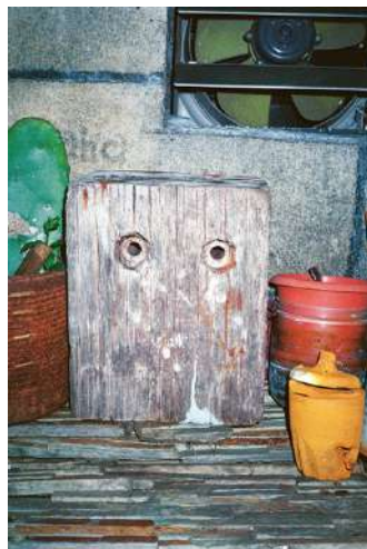
04_ © Alexandre Morvan